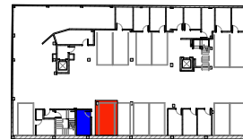
3 Localización trastero y garaje 1 : 1000